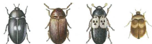
Pälssänger Brödbagge Fläskängar Vågbandad pälssänger

Om du får skadedjur i lägenheten, så har du ansvar för att åtgärda detta.